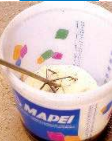
Mezcla de Mapeset con agitador mecánico

Las instrucciones para el uso seguro de nuestros