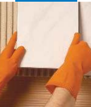
Colocación en pared de revestimiento cerámico